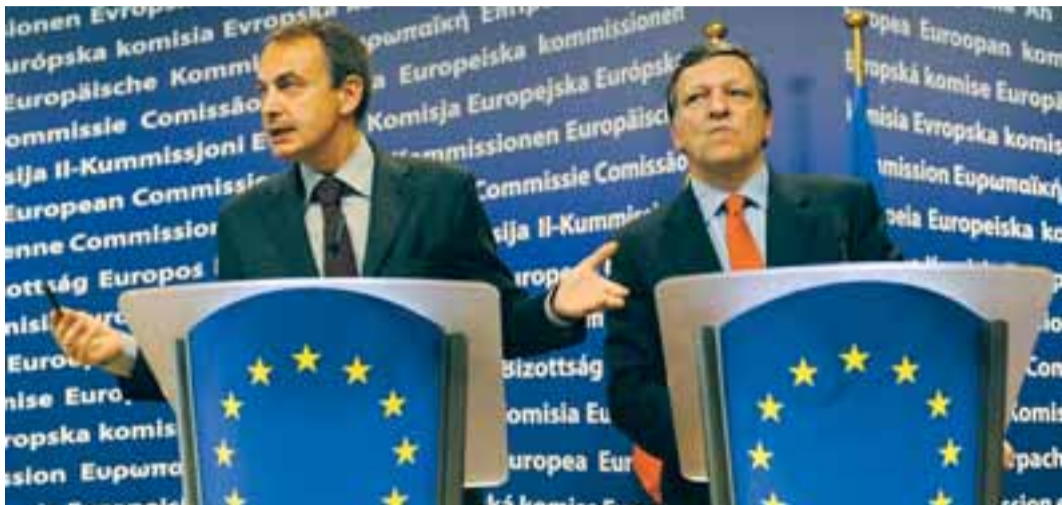
Trois dirigeants socialistes, dont l'Espagnol Zapatero (à gauche), soutiennent Barroso (à droite).

Pourtant, le traité de Nice comme celui de Lisbonne donnent au Parlement un droit de regard sur cette nomination, même s'ils diffèrent assez sensiblement sur les modalités pratiques de ce choix et plus encore sur la composition de la Commission. La Commission Barroso, entrée en fonction en novembre 2004, doit en principe achever son mandat le 31 octobre 2009. A cette date, il y a peu de chances que le traité de Lisbonne soit ratifié et appliqué. La nomination du président de la Com-